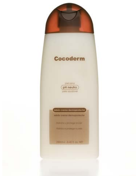
Botella 250ml o 750ml